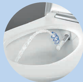
Im Geberit AquaClean Sela steckt die patentierte WhirlSpray-Duschtechnologie.

Licht ins Dunkel. Doch damit nicht genug: Neben dem angenehmen Duschstrahl stehen je nach Modell noch zusätzliche Verwöhnfunktionen zur Verfügung. So weist in der Nacht ein dezentes Orientierungslicht in einem von sieben wählbaren Farbtönen den Weg. Zu den weiteren Extras zählen eine WC-Sitz-Heizung, eine automatische Geruchsabsaugung, ein wohltuender Warmluftföhn und die TurboFlush-Spültechnik, dank derer sich die Toilette jederzeit geräuschlos und gründlich spülen lässt. Und mit seinem zeitlosen Design passt das Dusch-WC nahezu in jedes Badezimmerambiente. Neben dem Wasseranschluss wird als einziges Extra Strom benötigt. ■