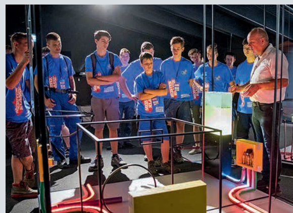
TAG 2: Die Führung durch die „Lebenswelt Wasser“ in Stainz ist ein Erlebnis für die Burschen aus dem ersten Lehrjahr.