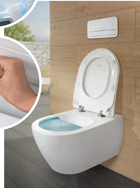
Sicher hoch vier: Mit dem „Hygiene Champion“ ist Sauberkeit ein Kinderspiel.