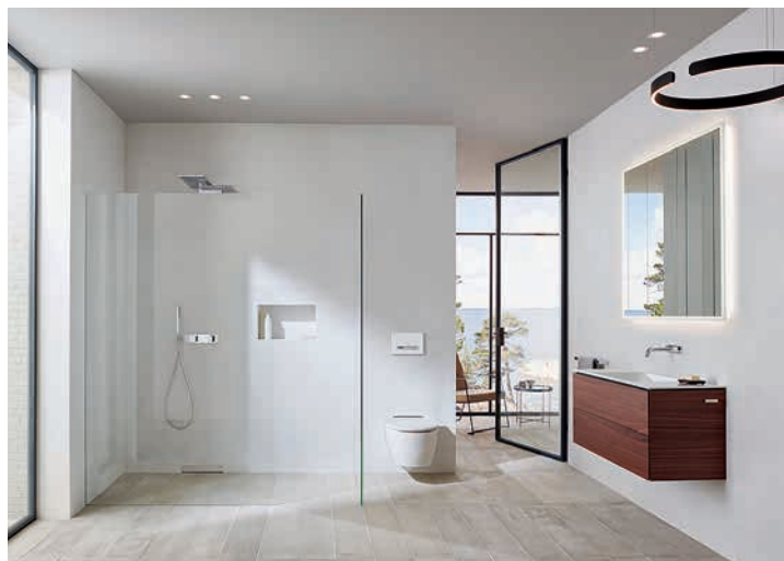
Geberit ONE steht für klares, zeitloses Design.