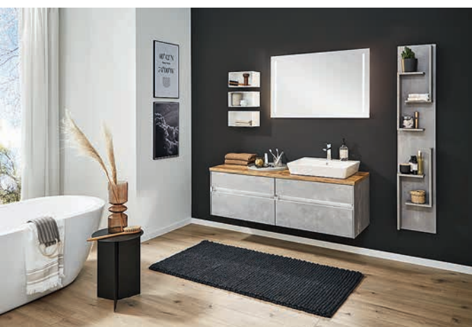
Klassisch und elegant präsentiert sich die LAGUNA-BADWELTEN-Serie „Pronto“.

Alle Infos im Geschäft oder unter www.meisterbad.at