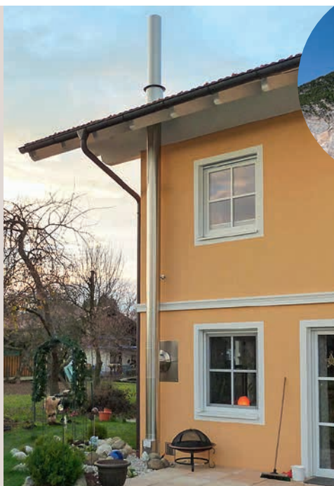
Außen und innen ein Eyecatcher: Edelstahlkamin NiroLine DW Design von Stocker

Dass der Kamin heute längst nicht mehr nur ein technisches Objekt sein muss, welches die Abgase der Heizanlage abtransportiert, beweist der doppelwandige Edelstahlkamin NiroLine DW Design des Kaminsystem-Spezialisten Stocker. Der „Designer“ unter den Kaminen sieht in Räumen genauso gut aus wie außen am Haus. Die zylindrisch eingezogenen Steckenden des Außenrohrs erlauben einen Aufbau ohne Klemmbänder. Die dadurch entstehende glatte Rohrsäule und die gebürstete Oberfläche machen den DW Design zum Glanzstück!