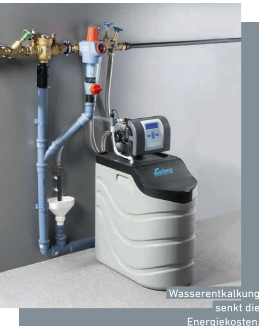
Wasserenthärtung senkt die Energiekosten.