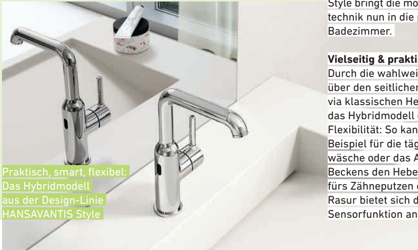
Praktisch, smart, flexibel: Das Hybridmodell aus der Design-Linie HANSAVANTIS Style

Eine neue Armatur aus der Reihe HANSAVANTIS Style lässt sich sowohl über einen Sensor als auch per Hebel bedienen. Was bringt der „hybride“ Wasserhahn?