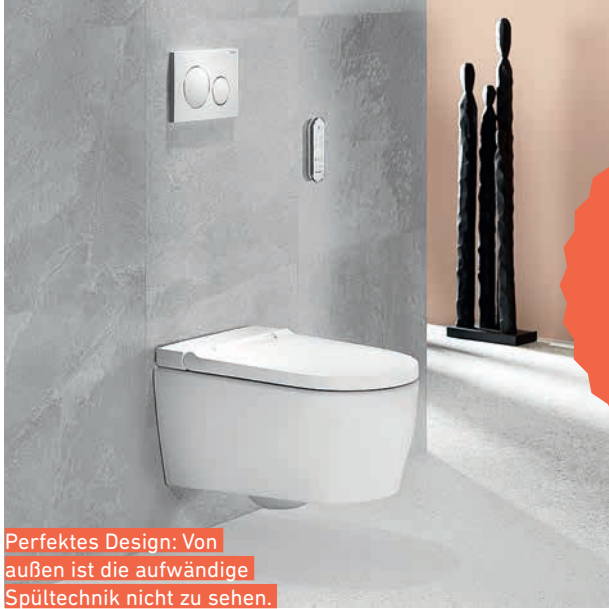
Perfektes Design: Von außen ist die aufwändige Spültechnik nicht zu sehen.

NEU! Das Geberit AquaClean Sela gibt es jetzt auch in der Trend-Oberfläche Weiß matt.