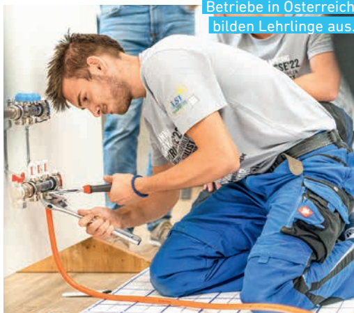
Alle 65 Meisterinstallateur-Betriebe in Österreich bilden Lehrlinge aus.

kniffligen Aufgaben. Aber am Ende sind die jungen Leute unglaublich stolz, wie selbstständig sie bereits Klimaanlage, Fußbodenheizungen, Duschkabinen und mehr montieren können. Und wir sind es auch, wenn wir sie in ihrer Weiterentwicklung begleiten!“